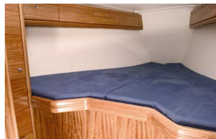
Stilren forkahyt i lækre materialer. Læg mærke til hvor mange små praktiske stuverum der er over køjerne.

Bavaria 33 Cruiser er forsynet med en ferskvandskølet Volvo-Penta D 1-20 med 18 hk, og det er rigeligt til at få båden til at gå over otte knob på fladt vand og selv i lidt krap sø går den sine 7 knob som marchfart. Så der er tilsyneladende rigeligt med overskudskraft og ikke flere undskyldninger for at komme for sent hjem, når man har været på havet.