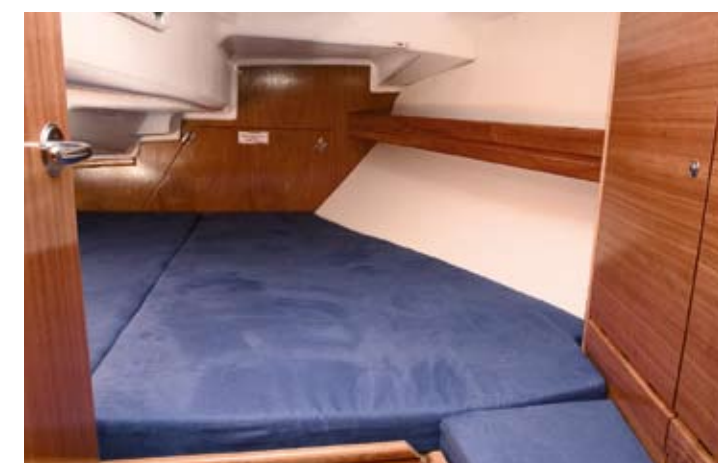
En pæn stor agterkahyt med delvis god højde, skabe og køjer i maxi-størrelse.

Cruisingpakken indeholder godkendt dansk gasinstallation inkl. gasflaske, fortøjninger, fendere, flag og flagspil, anker, blyankertov, transport fra værft, søsat og rigget i Egå med fuld (150 liter) dieseltank, bunden både primet og malet og et års medlemskab af Dansk Bavaria-klub.