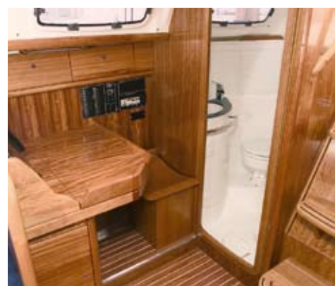
En god arbejdsplads, hvor man sidder i sejlretningen og har overblik over både hvad der ligger på bordet og instrumenterne foran. Toilettet er pænt og funktionelt men lidt trangt.

Cockpittets kvalitet med at fungerer både som veldisponeret terrasse, når båden ligger stille og som en tryk arbejdsplads, selv når båden sejler i hårdt vejr, går igen i salonens indretning. To sofa/køjer overfor hinanden (den ene L-formet) med et klapbord i midten, kan man sidde på og ved, både når båden smider til og står lodret. Ved navigationsbordet i styrbord side sidder man trygt og har ydermere front mod