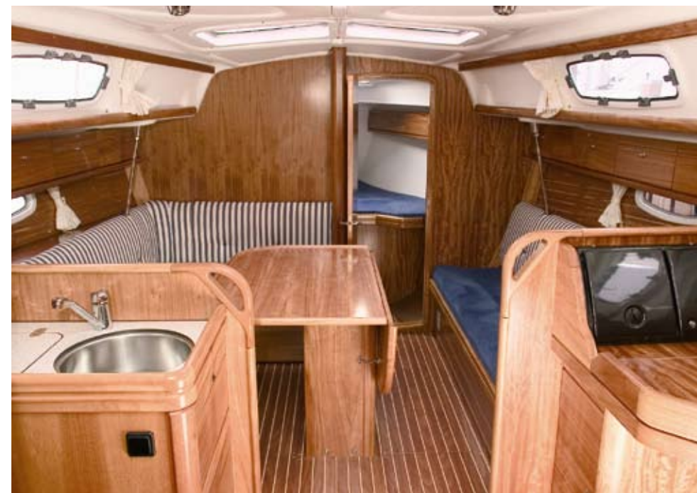
Der er en lys og enkel stemning om læ i den nye Bavaria 33.

Det vil være interessant at prøve båden med en