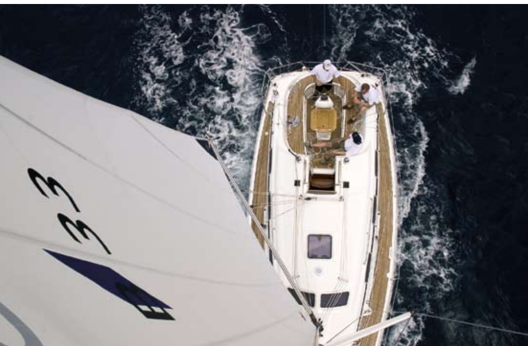
Dækket set lidt fra oven.