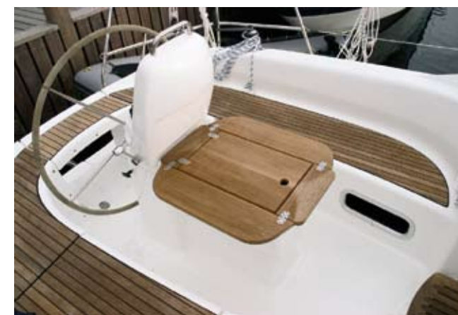
Cockpittet er forsynet med et stort, fast cockpitbord, som er godt holde ved, når man er til søs og godt at spise ved, når man er i havn.

Masten står solidt på ruffet uden lumske skødefangere, men med alle hal før agter til cockpittet, hvor et antal klemmer og et par veldimensionerede selvsødende spil på hver sin side af kahytsnedgangen, gør det nemt at betjene. Ikke noget med at skulle på dækket for at sætte, trimme eller bjerge sejl. Med hensyn til det "veldimensionerede", så går det igen som en fast regel for alt udstyr på båden lige fra søgelænder, mast og rig til skødevisere og klamper. Det giver en fornemmelse af tryk ombord.